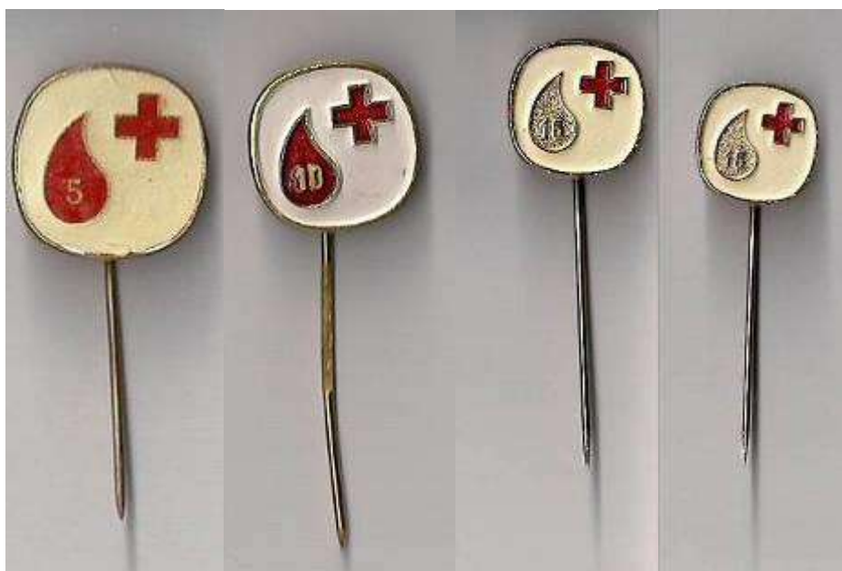
Značke za krvodajalce po letih sodelovanja (last arhiva dr. Šmida)

Zgoraj imenovani naj se odlikujejo z republiško srebrno značko.