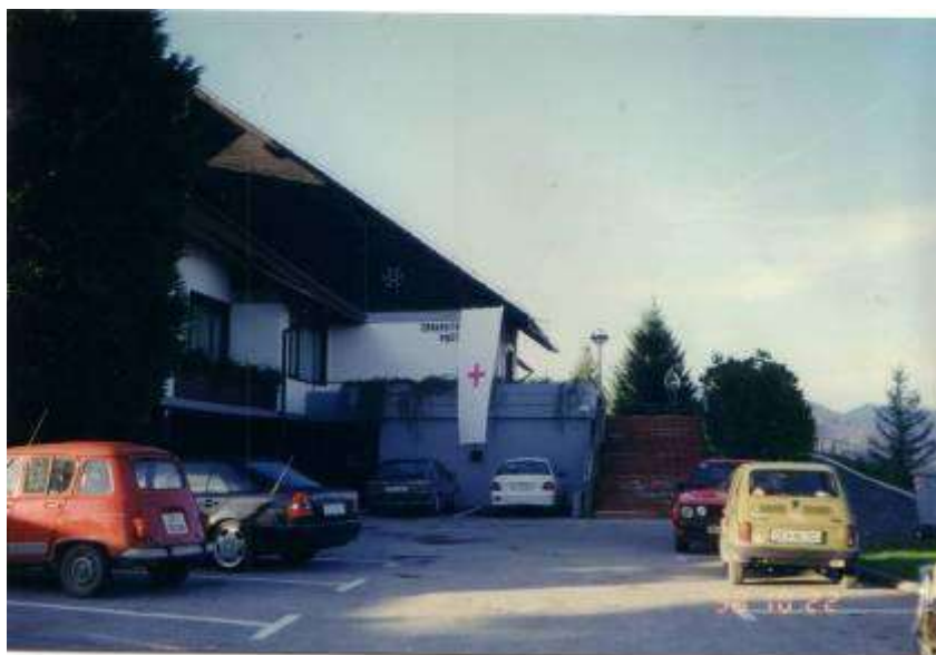
Bela zastava z rdečim križem (simbol RK) opozarja občane na krvodajalsko akcijo