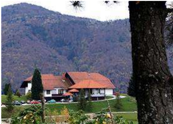
Zdravstvena postaja Planina pri Sevnici danes ( http://www.zd-sentjur.si/zgodovina.html )