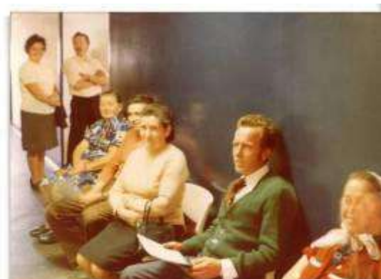
Čakanje na krvodajalsko akcijo