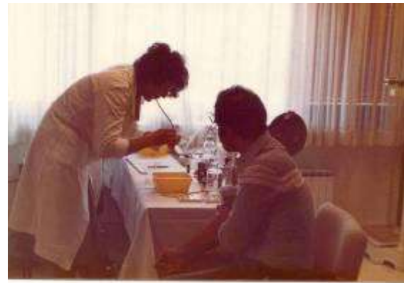
Odvzem krvi (sliki last dr. Šmida, stari več kot 30 let)