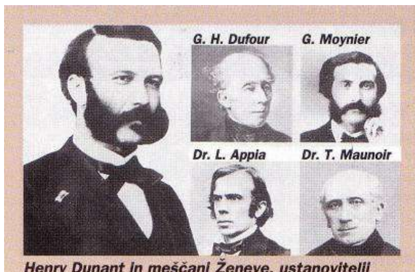
Henry Dunant in meščani Ženeve, ustanovitelji RK

V Sloveniji je bil RK ustanovljen leta 1944, v okviru njega pa je delovalo tudi krvodajalstvo.