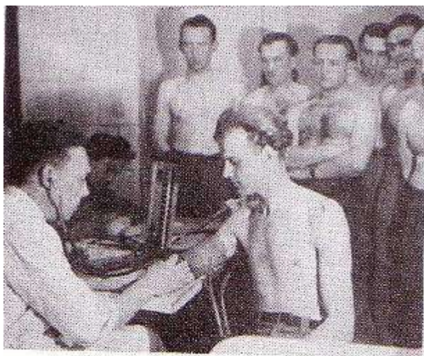
Darovalci krvi — rudarji, na prvem odvzemu krvi v Zagorju, 1953 (pregled pri zdravniku)