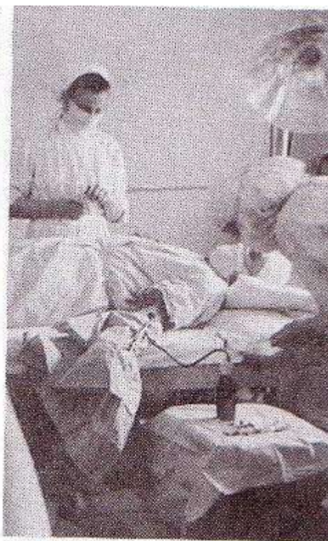
(Slika iz Glasila RK, 1998)